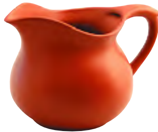
ちゃかい 茶海 (ピッチャー)