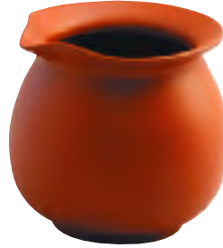
ちゃかい 茶海 (ピッチャー)