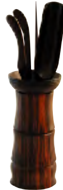
ちゃく 茶具セット