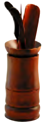
ちゃく 茶具セット