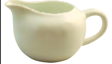
ちゃかい 茶海 (ピッチャー)