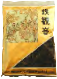
てつかんのんちゃ 鉄観音茶