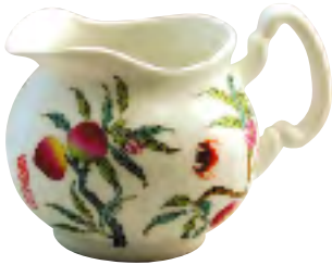
ちゃかい 茶海 (ピッチャー)